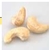
Noix de cajou