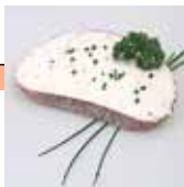
Fromage frais sur une tranche de pain