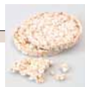
Galettes de riz