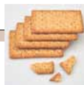
Crackers à la farine complète